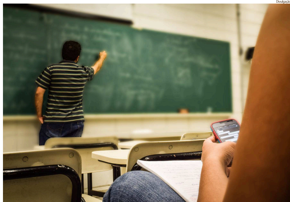
Valor de R$ 2.886,24 é 12,84% maior do que o estipulado para 2019

O texto estabeleceu que o piso salarial dos professores do magistério é atualizado, anualmente, no mês de janeiro