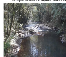
DIVISA ENTRE OS MUNICÍPIOS DE CANTAGALO E GOIOXIM- RIO JUQUÁ E RIO DOS PEDROSOS

Cantagalo- Goioxim: Rio Juquá e Rio dos Pedrosos