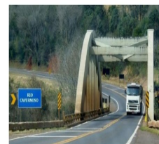
DIVISA ENTRE OS MUNICÍPIOS DE CANTAGALO E CANDÓI- RIO CAVERNOSO