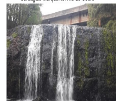
DIVISA ENTRE OS MUNICÍPIOS DE CANTAGALO E MARQUINHO- RIO DO COBRE

Cantagalo- Goioxim: Rio Juquá e Rio dos Pedrosos