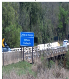
DIVISA ENTRE OS MUNICÍPIOS DE CANTAGALO E VIRMOND- RIO CANTAGALO

Os limites entre os municípios com os quais Cantagalo faz divisa, é quase 100% delimitado por rios: