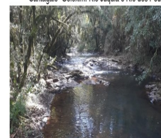
DIVISA ENTRE OS MUNICÍPIOS DE CANTAGALO E GOIOZIM- RIO JUQUIÁ E RIO DOS PEDROSOS

Cantagalo- Goiozim: Rio Juquiá e Rio dos Pedrosos