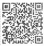
Figura: 14123147585720 11/10/2023 04:31:36 580481