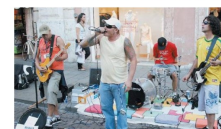
Show realizado na Feira da Calçada, Lugar Nenhum (2022).

Caso o agente cultural não tenha os links e queira comprovar com prints de publicações, reportagens ou fotos, poderá acrescentar de maneira cronológica e devidamente identificado, como nos exemplos a seguir: